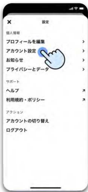
Step 2 <アカウント設定> ボタンをタップ