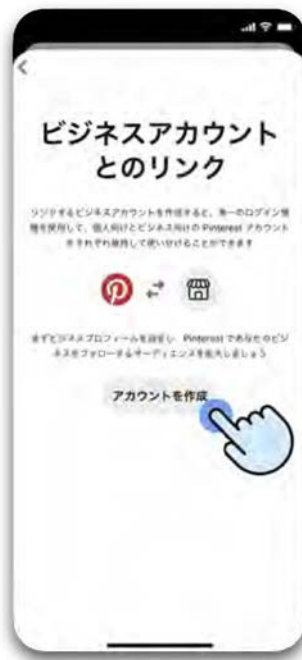
Step 4 <アカウントを作成>をタップ