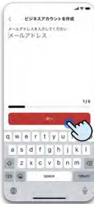
Step 5 メールアドレスなど必要な情報 を入力し、完了をタップ