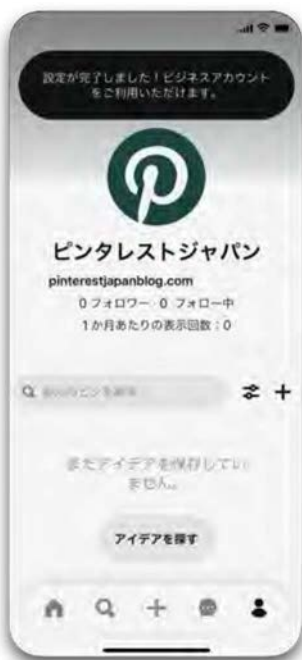
ビジネスアカウント 作成方法（無料）