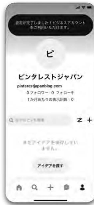
Done! ビジネスアカウントの作成完了