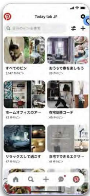
Step 1 個人向けアカウントのプロフィール から、右上のボタンをタップ